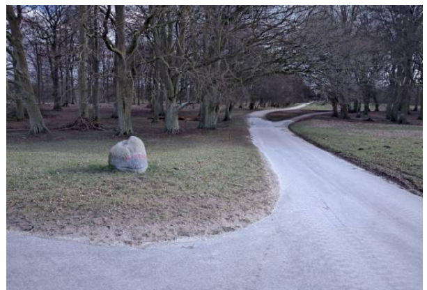
stien mod Klampenborg