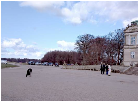
parkeringsarealet ved slottet